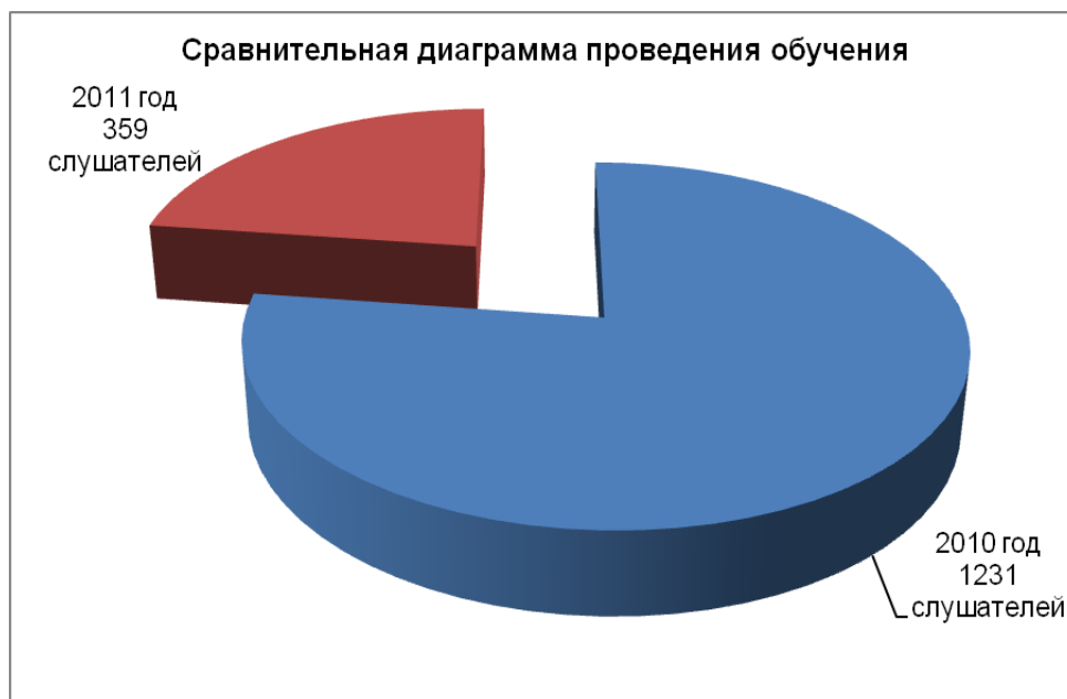
Диаграмма №2. Сравнительная диаграмма проведения обучения за 2010 и 2011 годы

Центр судей успешно сотрудничает с проектом Германское общество по международному сотрудничеству (GIZ) Проект «Поддержка правовой и судебной реформы в странах Центральной Азии».